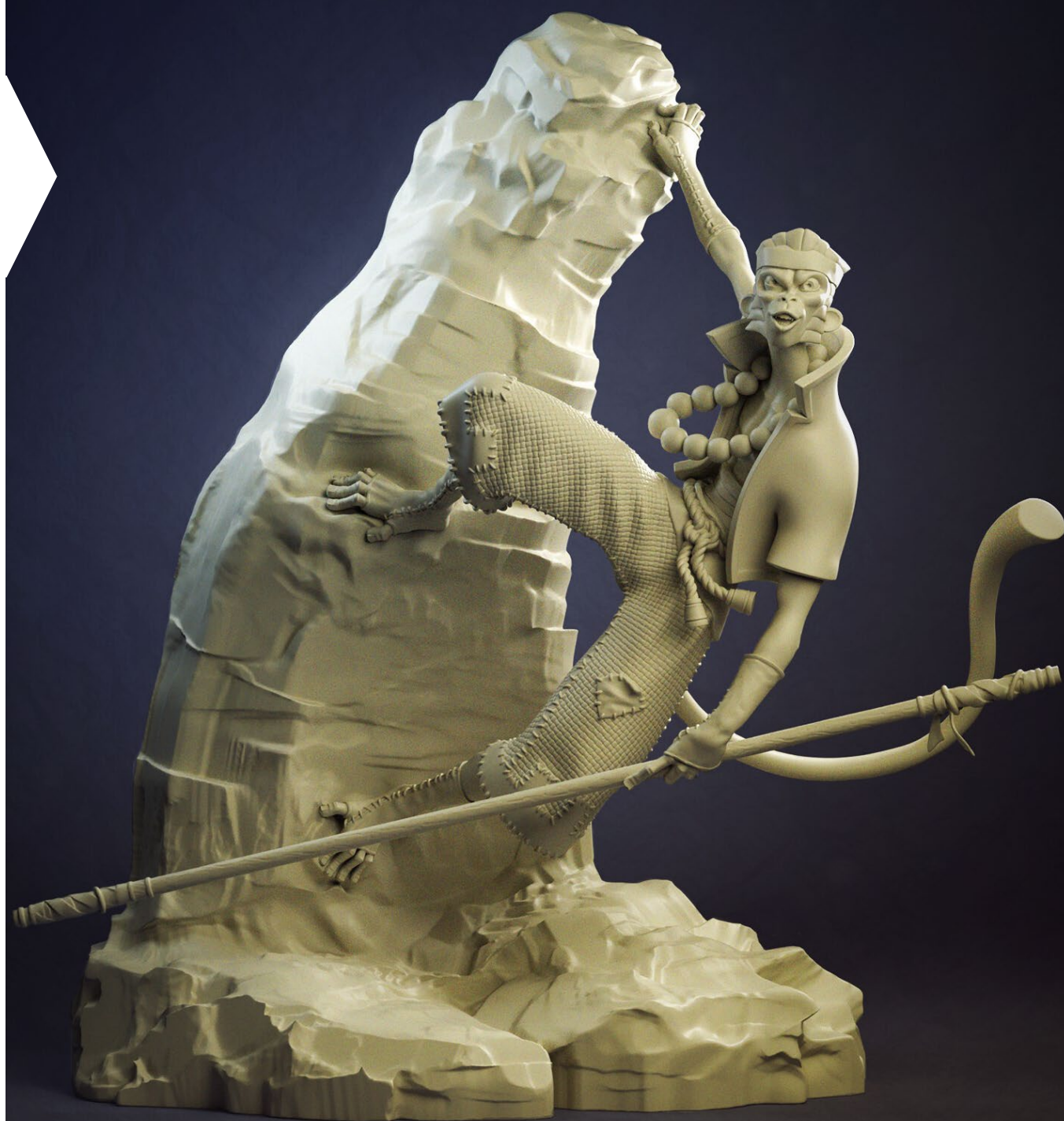
Trabajo del alumno Ibai Cia

Exploraremos su interfaz y las diferentes herramientas para esculpir desde formas inorgánicas y detalles hasta modelos más orgánicos. Este módulo te llevará a desbloquear tu creatividad y dominar las posibilidades ilimitadas del programa.