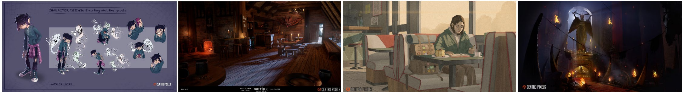
Trabajos de portafolio de nuestro alumnado

Además, a lo largo del curso, tendremos tres masterclasses impartidas por artistas referentes dentro de la industria del cine de animación y videojuegos, que aportarán nuevas perspectivas y consejos al alumnado.